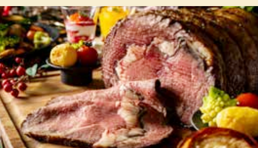
季節替わりのフェア料理