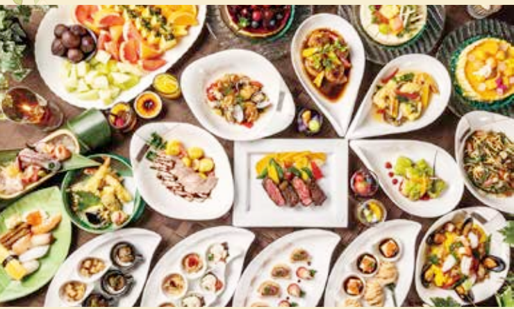
四季食材の和洋料理

shizuku のビュッフェはお食事はもちろん、 フェア料理やデザートまで存分にお楽しみいただけます。