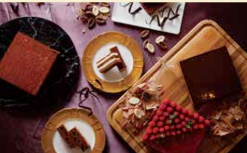
季節替わりのホテルスイーツビュッフェ